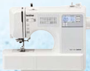
コンピュータミシン S51-PW

私が幼い頃、 母が手づくりのものを 作ってくれた。 お店に売っているものよりも、 母が作ってくれたものが 一番のお気に入りだった。 そんな私も、母となった。 今度は、私が子どもに 手づくりしてあげようと思う。