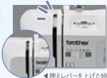
◀ 押えレバーを上げた時

「天びん」への糸かけは、押えレバーが上がった状態でないと掛けられないから、安心。