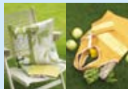
クッションカバー エコバッグ&収納ポーチ