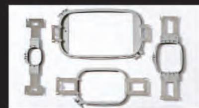
同梱枠サイズ: ●300×200mm、●180×130mm、 ●100×100mm、●60×40mm

①1分間に最高1,000回転の縫製速度と 同梱の4種類の刺しゅう枠と多様なアク セサリーが、ビジネスユースに最適。