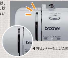
←押えレバーを上げた時