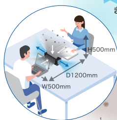
パーソナルスペース概念図

パーソナルスペースにおけるエアロゾル *1 の吸引に特化した「DF-2」は、ブラザー独自設計の左右のファンが強力な吸引力を発生させ、前後および上面の3方向から空気中に漂うエアロゾル *1 をパワフルに吸引します。