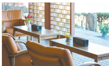
*ここの内容はフィルターの性能を指しております。

コンパクトながらもエアロゾル除去率99.97%という高い吸引性能*が採用の決め手となり、第三者機関による評価試験も実施されているため、安心して導入できました。大切なお客様をお迎えする受付やレセプションエリアでは、従来型の空気清浄機は大きすぎて置けないですが、DF-2はコンパクトサイズなのに、会話によるエアロゾルを瞬時に吸引してくれるのも決め手の一つになりました。当館の雰囲気に馴染むデザインも気に入っています。