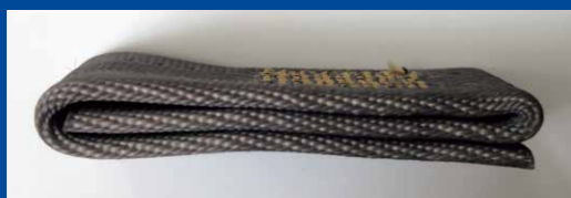
シートベルトの6重縫い

高い剛性のサーボ制御送り機構と、極厚物でも確実に安定した糸締めによる丈夫な縫製を実現します。また、上糸繰り出し装置を標準装備しており、縫い始めの糸抜けや目飛び等、縫製不良を防ぎ高い縫製品質を保ちます。