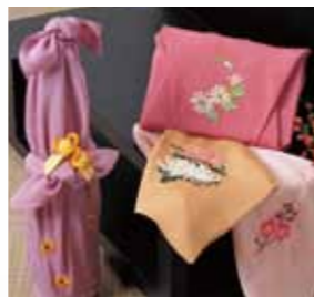
ファンシーグッズ

受け取る人に特別な想いを届けるためのギフトやノベルティには、刺しゅうで特別な価値を与えることが出来ます。ブランドロゴ、メッセージや名入れなど、創作性の豊かな刺しゅうを効率よく施すことができます。