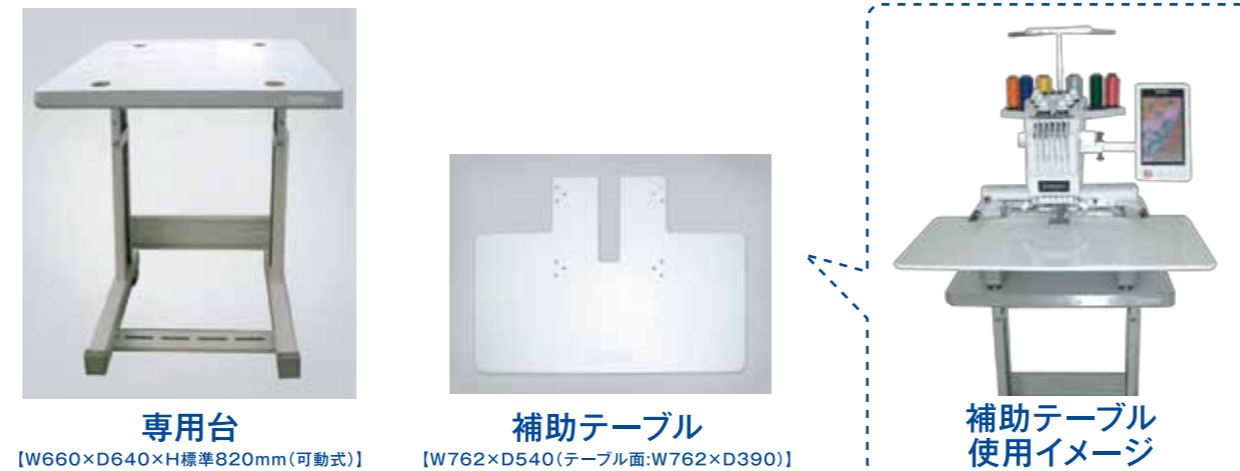
専用台 [W660×D640×H標準820mm(可動式)] 補助テーブル [W762×D540(テーブル面:W762×D390)] 補助テーブル使用イメージ

人気のある様々なスタイルの帽子に簡単・スピーディに刺しゅうできる帽子枠と、ネーム刺しゅうに最適化された7タイプのネーム刺しゅう枠に加え、筒状の服・ズボン等の刺しゅうに便利なシリンダー枠、厚地も楽に縫える平枠が用意されています。