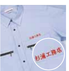
ワーキングウエア