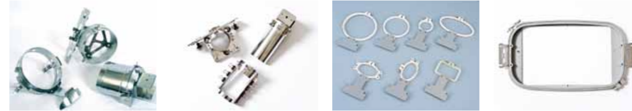
帽子枠セット シリンダー枠セット ネーム刺しゅう枠 平枠

人気のある様々なスタイルの帽子に簡単・スピーディに刺しゅうできる帽子枠と、ネーム刺しゅうに最適化された7タイプのネーム刺しゅう枠に加え、筒状の服・ズボン等の刺しゅうに便利なシリンダー枠、厚地も楽に縫える平枠が用意されています。